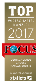
Auszug aus FOCUS-SPEZIAL „Deutschlands Top-Anwälte 2017“